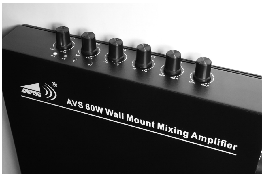
60W Wall Mount Mixing Amplifier PA-C60PB / PA-C60PB-USB